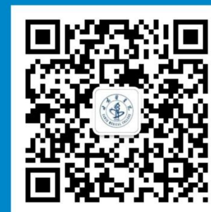
甘肃医学院官方微信

甘肃医学院前身是始建于1958年的甘肃省平凉卫生学校，2003年升格为平凉医学高等专科学校，2015年组建晋升为医学本科院校，更名为甘肃医学院。开设有临床医学、预防医学、针灸推拿学、儿科学、康复治疗学、药学、中医学、护理学、助产学、医学检验技术10个本科专业和11个专科专业。学校有1家直属附属医院、2家非直属附属医院、39个实践教学基地、4个社区基地、7个实验教学中心，其中省级实验教学示范中心4个。建有全国基层西学中能力建设带教基地、国家医师资格考试中医类别实践技能考试基地。直属附属医院建有全国住院医师规范化培训基地、全国肝炎患者教育基地、甘肃省骨科研究所分所、甘肃省肝胆胰外科研究所分所、兰州大学临床医学院肿瘤防治中心分中心。