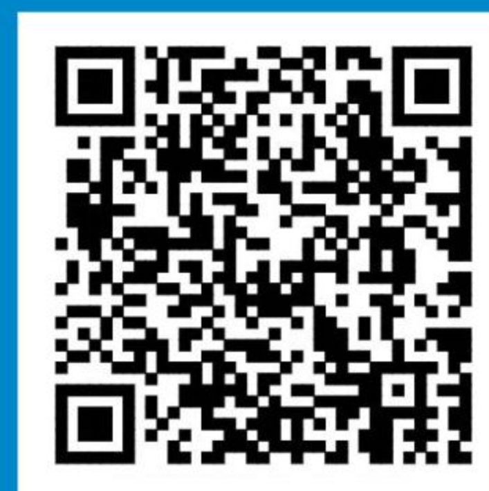
甘肃医学院招生网